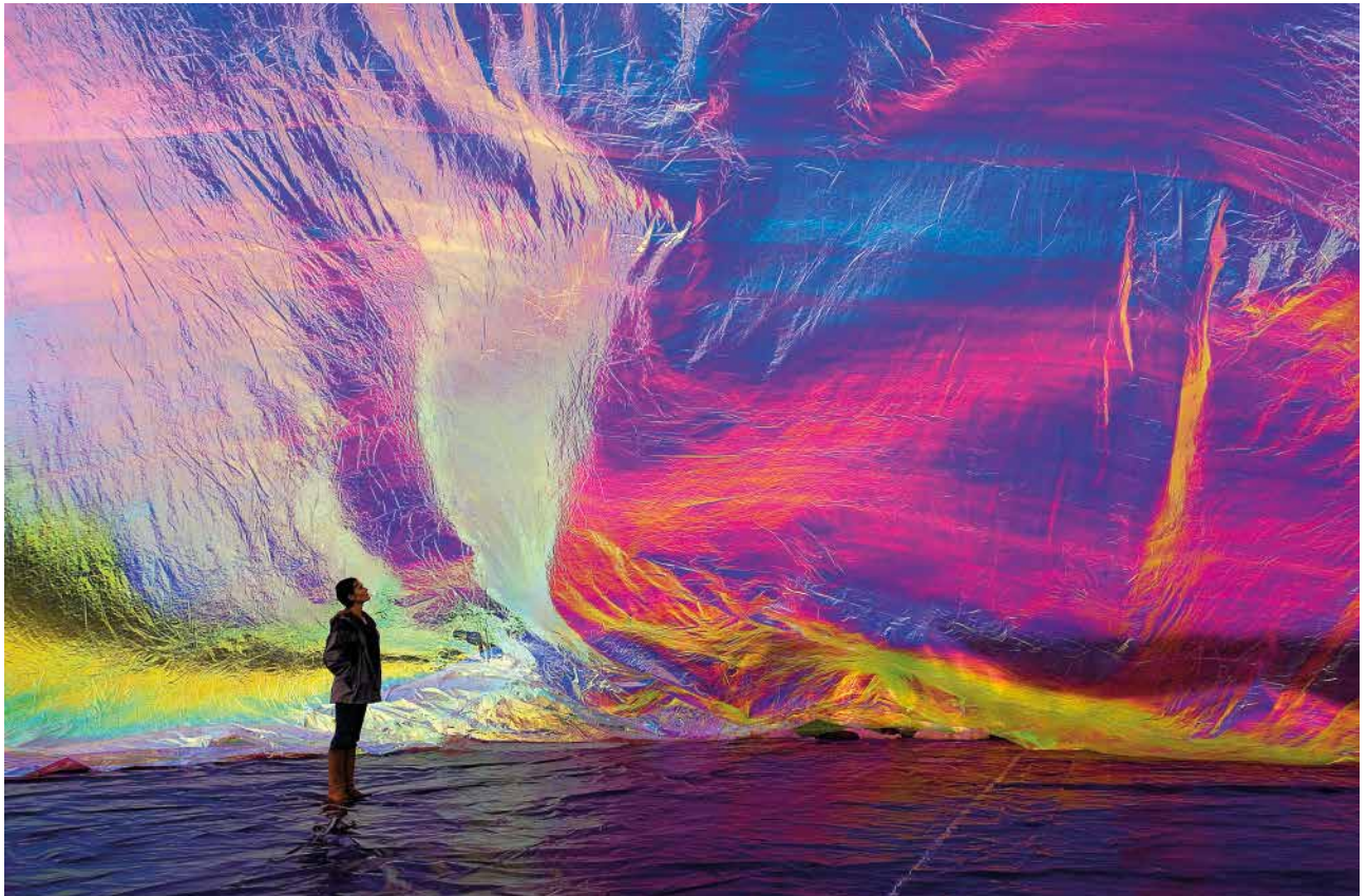
ABB. 2: TOMÁS SARACENO. POETIC COSMOS OF THE BREATH , 2007

Sozialwissenschaftliche Fragestellungen zu individuellen und allgemeinen, aber auch gruppenspezifischen Anwendungen bestimmter Leitfarben wie auch zu politischen und Hierarchien definierenden Farbcodes bildeten einen dritten Themenkreis, der das inszenatorische und manipulatorische Potential des Mediums ebenso in den Blick nahm wie die Strategie, sich mittels der Farbe zu verbergen. 37 Anhand künstlerischer Äußerungen wurde hier der Fokus auf deutsch-deutsche Parallel- bzw. divergierende Entwicklungen von ‚Farbcodes‘ vor und nach der deutschen Vereinigung gerichtet.