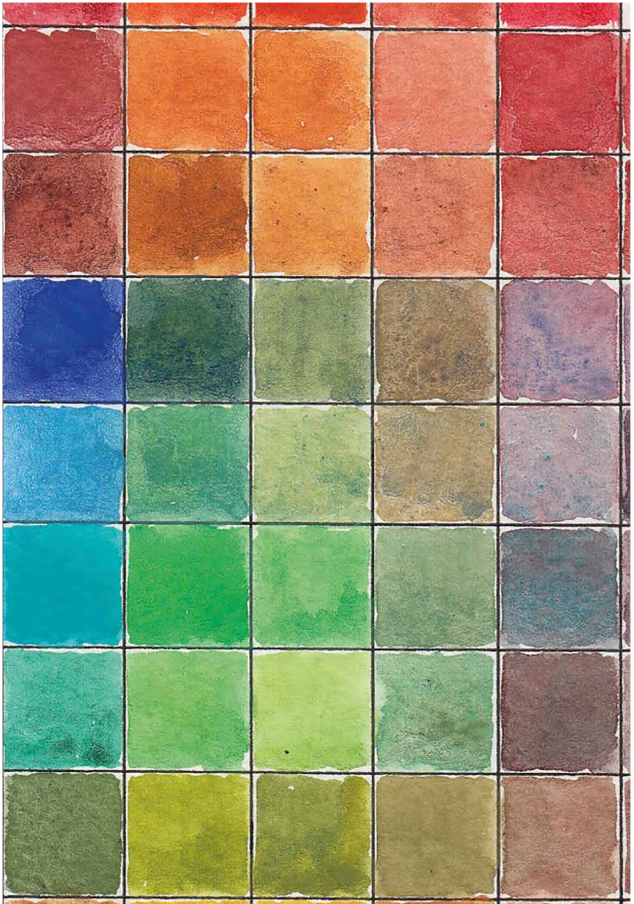
ABB. 3: MUSTERKARTE FÜR AQUARELLFARBEN, DETAIL