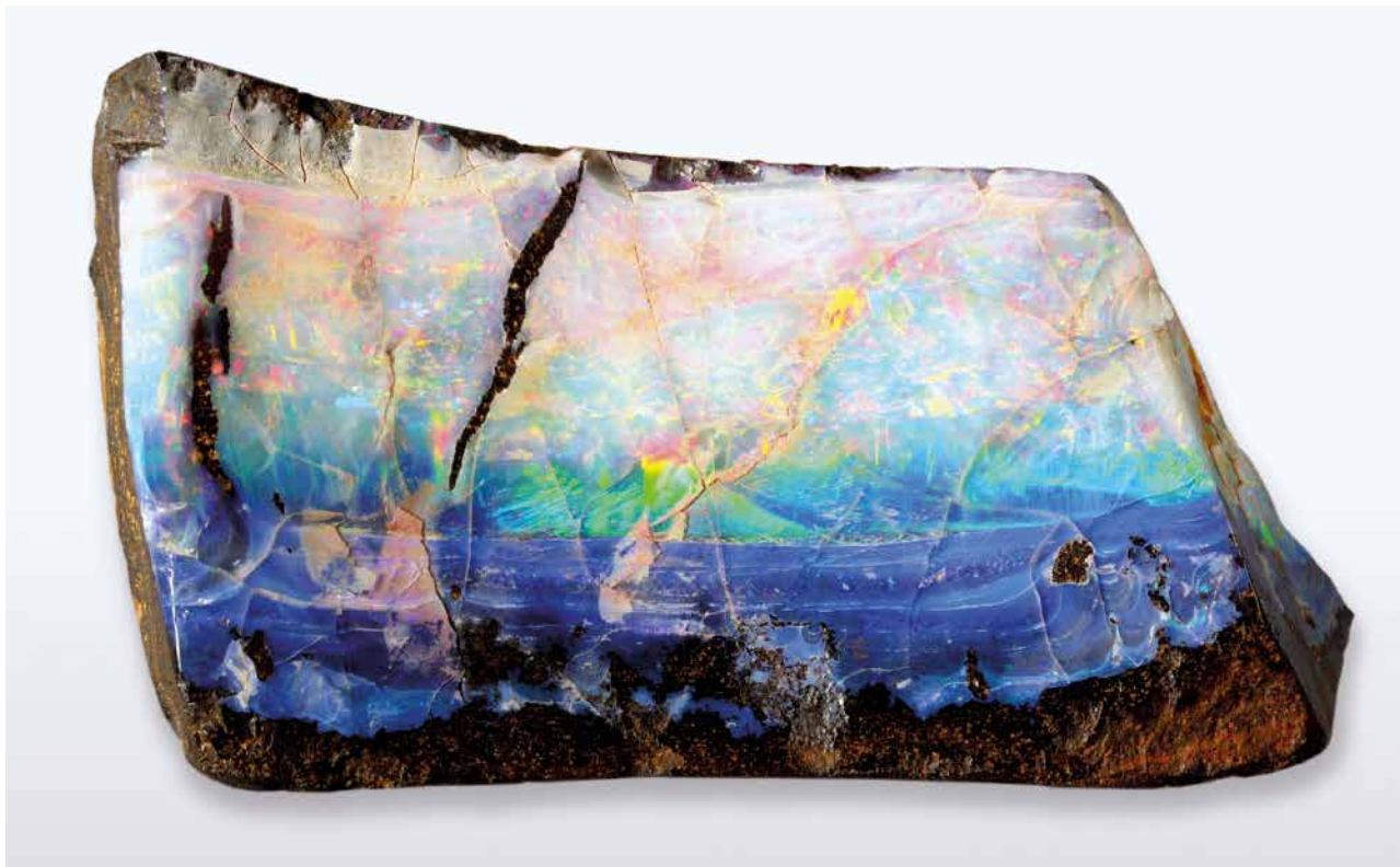
ABB. 1: OPAL, HERKUNFT AUSTRALIEN